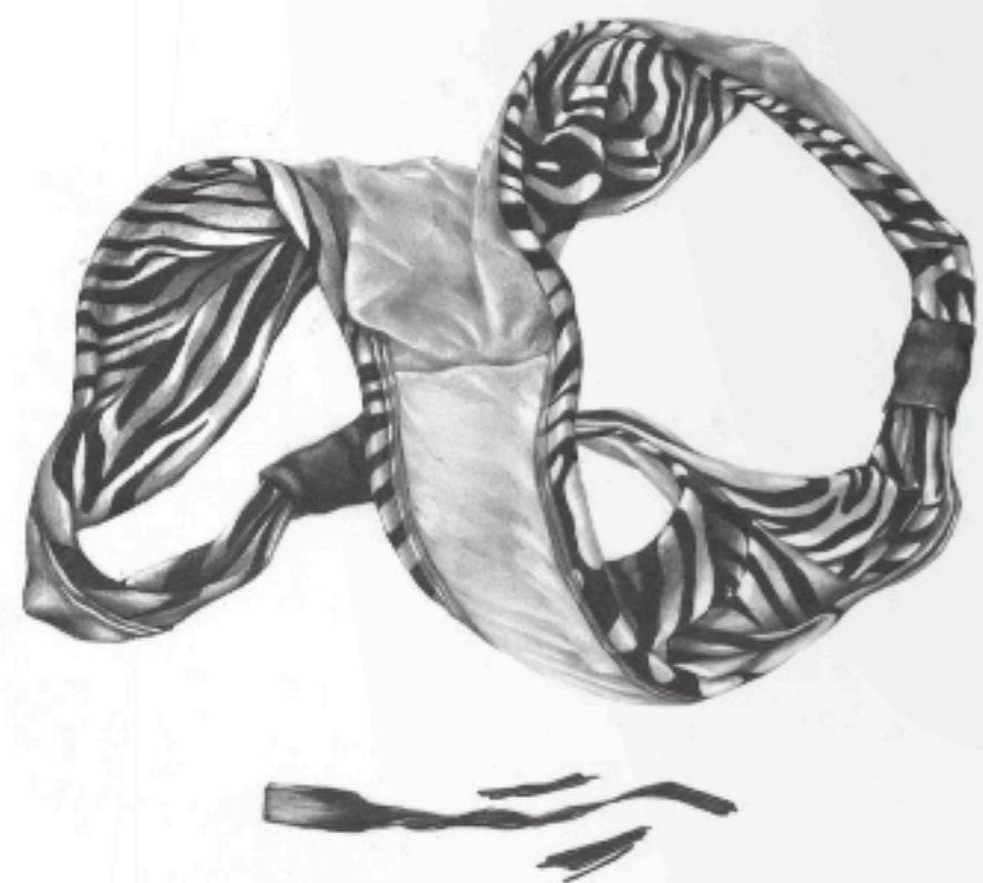
Fantine Andrès - Skull